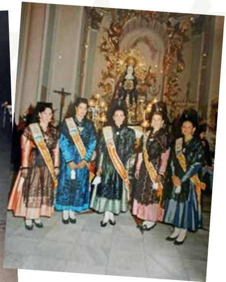
Reina i dames de l'any 1994